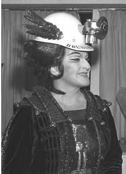
Nilsson ei välittänyt Herbert von Karajanin pimeistä näyttämökuvista, ja ilmestyi harjoituksiin päässään kaivostyöläisen kypärä.