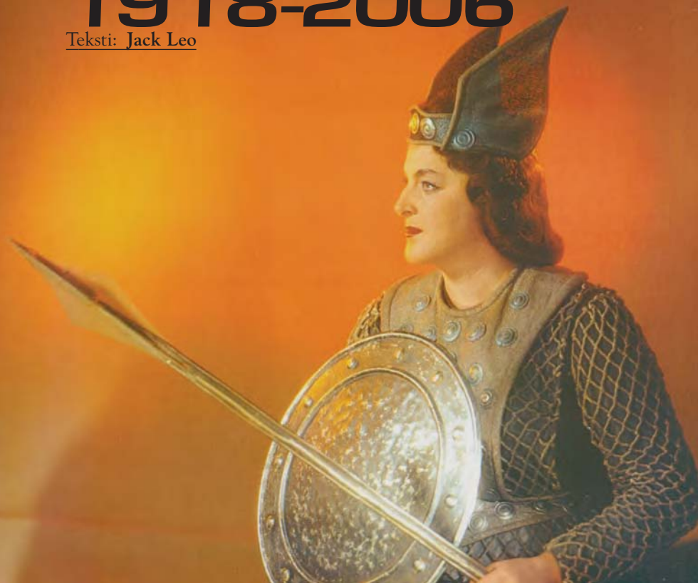
Birgit Nilsson, yksi kaikkien aikojen suurimmista Wagner-laulajista, Brünnhildenä Wienissä vuonna 1957.

1900-luvun loppupuoliskon epäilemättä suurin Wagner-sopraano, ruotsalainen Birgit Nilsson , kuoli joulupäivänä 87-vuotiaana.