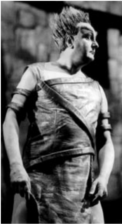
Bayreuther Festspiele GmbH/Wilhelm Rauh