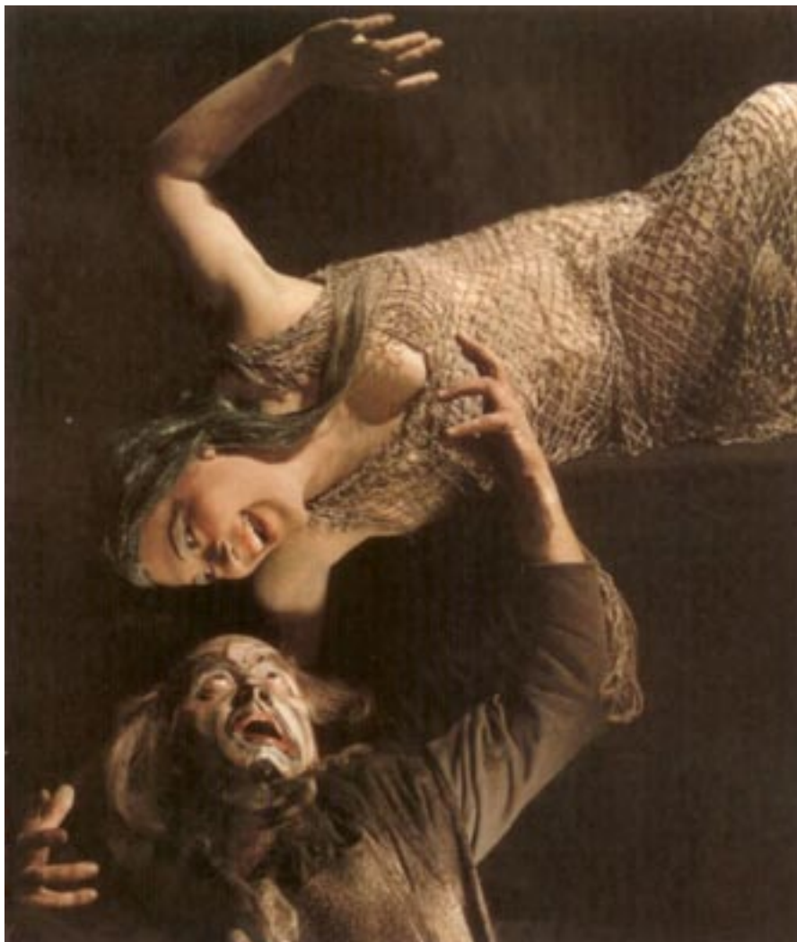
Bayreuther Festspiele GmbH

tuttivat kreikkalaisia jumalia tai jopa näiden patsaita. Näyttelemineen oli tyylliteltyä. Nämä ohjaukset herättivät sekä ihastusta että kauhistusta. Esitettiin arveluja, että synnä lavasteiden vähäisyyteen olisi ollut rahanpuute. Jotkut muistuttivat Richard Wagnerin itsensä sanoneen: ”Luotuani näkymättömän orkesterin voin ehkä luoda myös näkymät-