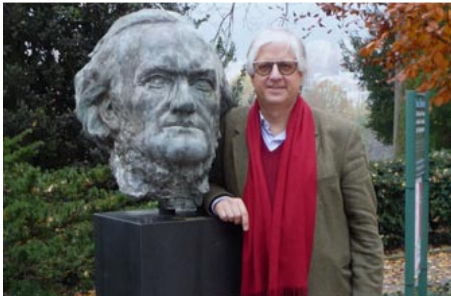
Teksti ja kuvat: Klaus Billand