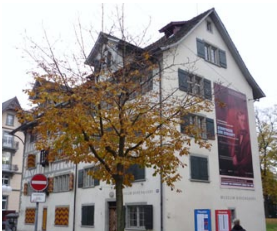
Museo Bärengasse Zürichissä.

Toisen vaiheen (1851-1857) keskipisteenä oli näyttämöteos Nibelungin sormus , jonka tien alun perin Weimarin oopperalle suunnitellusta sankarioopperasta ” Siegfrieds Tod ” (Siegfriedin kuolema – suom. huom.) vuodelta 1848 Sormus-tetralogiaksi vuonna 1851 hän kuvasi kirjoituksessaan ” Mittheilung an meine Freunde ” (Tiedonanto ystäväilleni – suom. huom.). Vuoden 1853 helmikuussa saattoi Wagner julkaista neljä Zürichissä yksityisesti painettua kappaletta Ring-runoelmastaan, runoelman kaksi viimeistä osaa tosin vielä nimellä Nuori Siegfried ja Siegfriedin kuolema . Vasta vuonna 1856 hän päätyi lopullisiin nimiin Siegfried ja Jumalten tuho . Vuoteen 1853 osuivat myös ensimmäiset Wagner-musiikkijuhlat siinä mielessä, että hän johti Zürichin konserttiansa puitteissa Rienzin rauhanmarssin