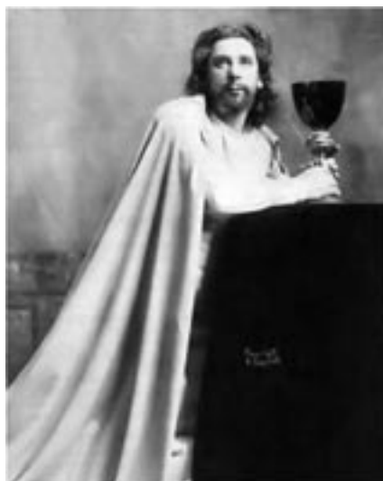
Vasemmalla Milka Ternina Kundryna, yllä Alois Burgstaller Parsifalina, oikealla kapellimestari Alfred Hertz.