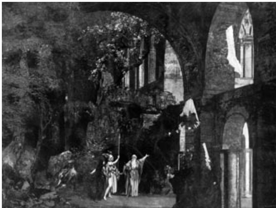
Siirtyminen Graalin temppeliin. Lavasteluonnos kolmanteen näytökseen.