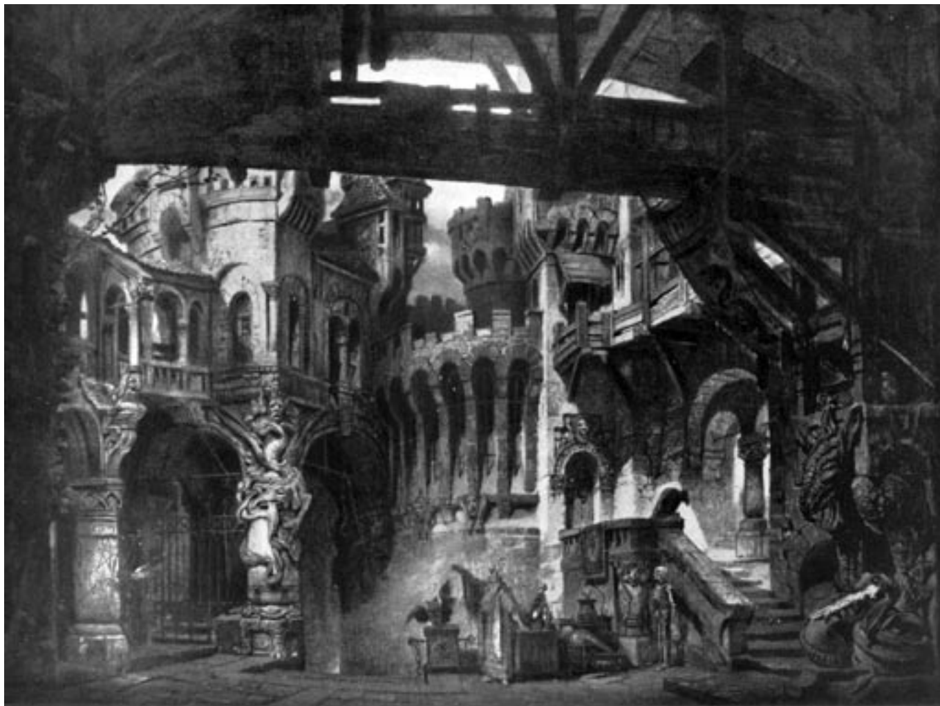
Lavasteluonnos Klingsorin valtakunnaksi.