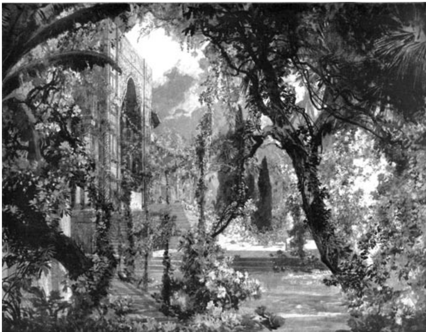
Luonnos taikapuutarhan lavastukseksi.